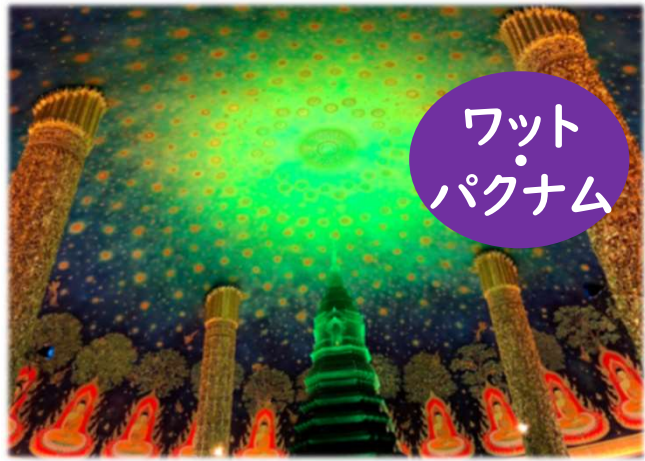
ワット・パクナム