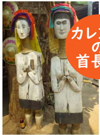
カレン村の首長族