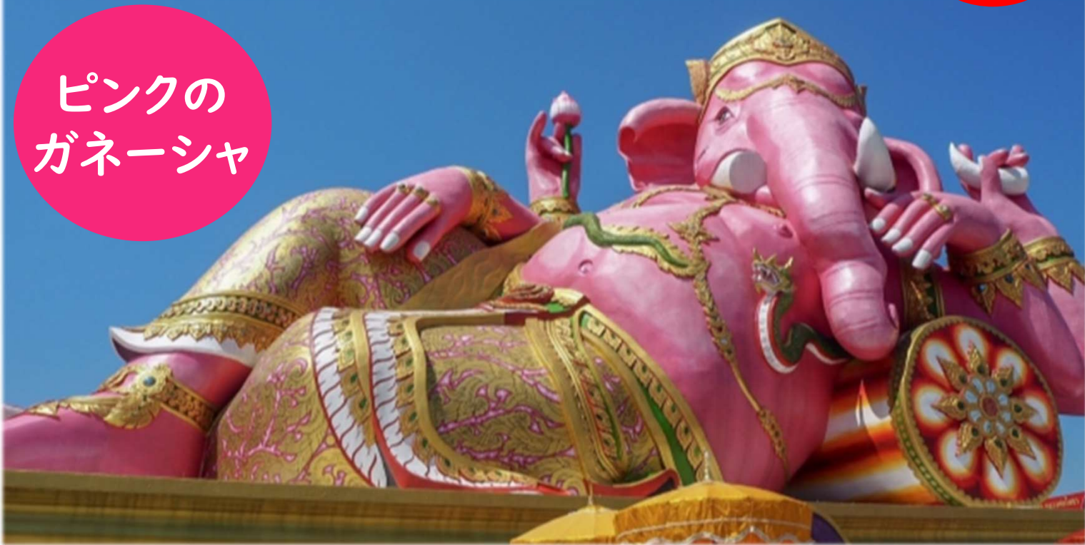
ピンクのガネーシャ